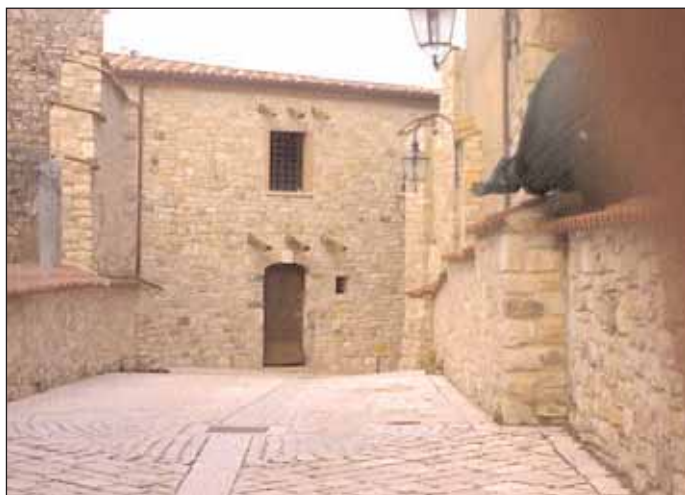
Il centro storico diverrà campus universitario

Gli istituti saranno realizzati con i fondi comunitari della Regione Campania, gli svizzeri si occuperanno della didattica, in quanto detentori del marchio e del metodo, mentre i Comuni gestiranno le strutture.